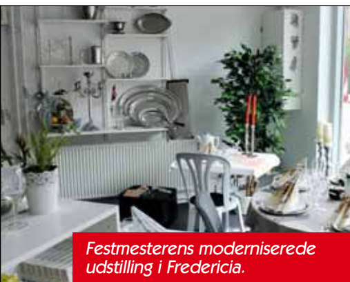
Festmesterens moderniserede udstilling i Fredericia.