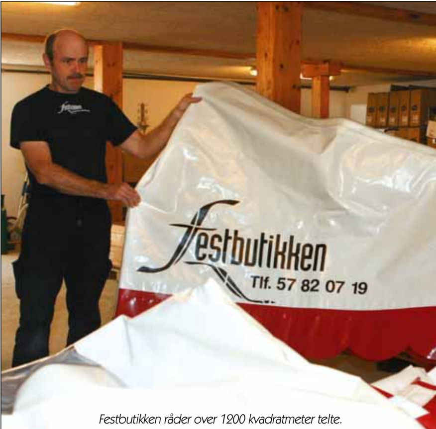
Festbutikken råder over 1200 kvadratmeter telte.