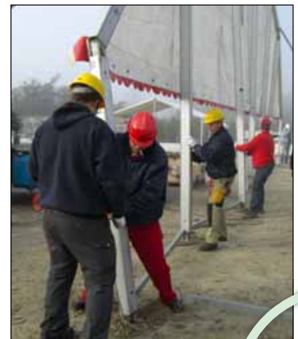
Opstilling af store telte kræver viden og indsigt.

– Informationsindsatsen fra tidlig morgen til sen aften har krævet meget. På en og samme dag deltog jeg i udsendelser på tre TV-stationer samt Nordjyllands Radio. Det var for øvrigt den dag, jeg fungerede som sekretær på en generalforsamling, men på forunderlig vis nåede vi det hele, pointerer den nordjyske festudlejer.