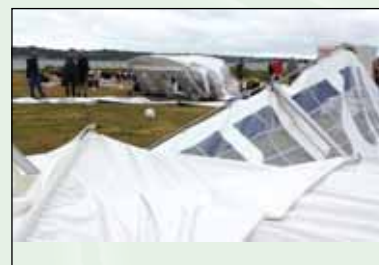
På få øjeblikke blev festteltet fra Thisted Serviceudlejning krøllet sammen til ukendelighed.

– De nuværende bestemmelser bør forenkles, ansvaret for myndighedsbehandlingen og opfølgning bør klargøres, og der bør indføres