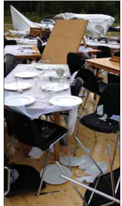
Skypumpen kastede rundt med borde, stole og service.

Han har fået mange reaktioner efter den dramatiske hændelse.