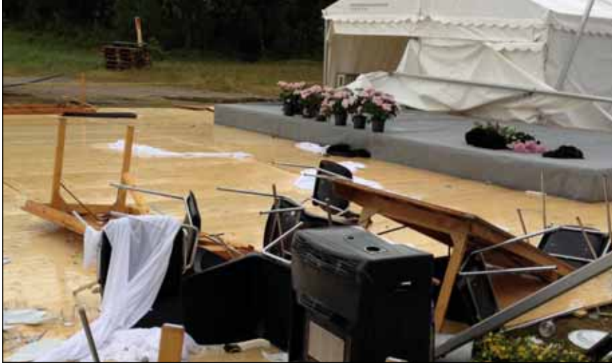
Det flot pyntede telt blev raseret af den voldsomme vind.