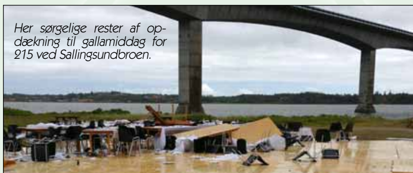
Her sørgelige rester af opdækning til gallamiddag for 215 ved Sallingsundbroen.