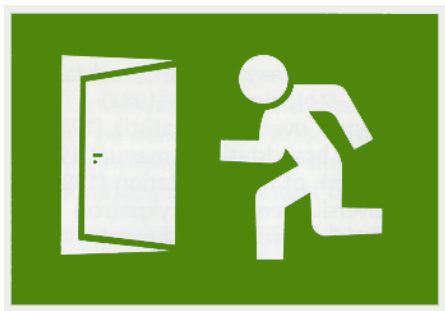
Fig. 1: Skiltet er grønt med piktogram og skal opfylde Arbejdstilsynets bestemmelser om sikkerhedsskiltning.

Flugtvejsskilt: Et sikkerhedsskilt (se fig. 1), som giver anvisning vedrørende nødudgange og flugtveje.