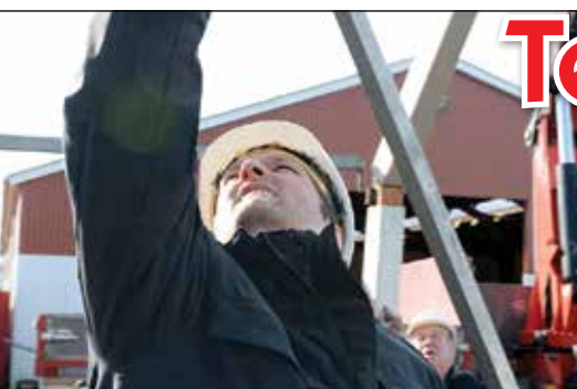
En lille fejl kan være med til, at et telt kollapser. Derfor er det vigtigt, at teltkonstruktørerne ved, hvad der skal være i orden.