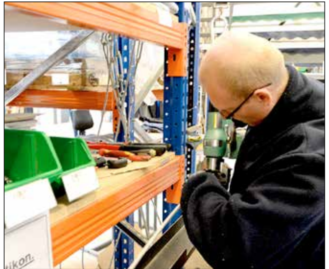
En medarbejder står konstant og laver stålwirer til kryds i teltes top og sider. Efterspørgslen har været kolossal efter, at de nye certificeringsregler er trådt i kraft.