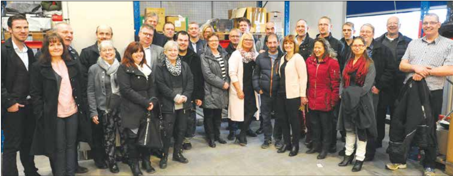
I alt 30 medlemmer af Brancheforeningen Danske Festudlejere var mødt op til et udbytterigt virksomhedsbesøg hos Brønnum i Herlev.