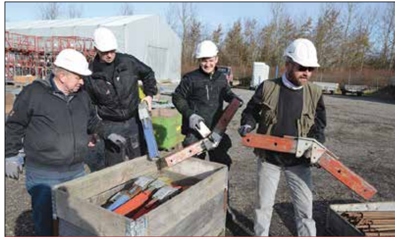
Et godt team samarbejde er en forudsætning for, at en teltopstilling sker effektivt.