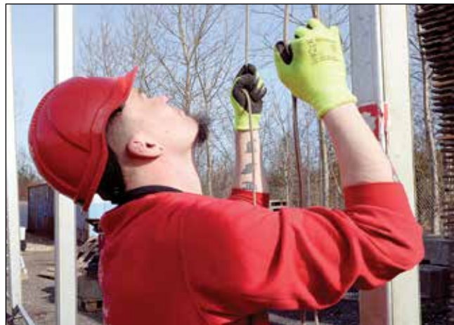
Der er mange funktioner ved teltopstillinger, som teltmontørerne skal være inde i og som man ikke uddannes optimalt i ved sidemandsoplæring.