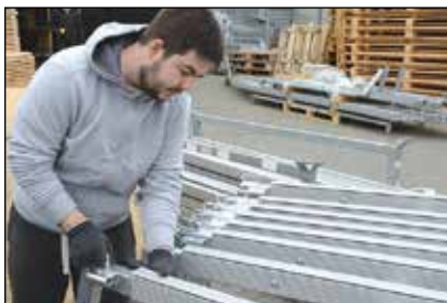
Der samles teltkonstruktioner i stride strømme hos Zederkof, Fredericia, som har landets mest omfattende og mest fleksible beregnede konstruktioner.

Tre certifikater på samme teltbredde gør det muligt at tilpasse konstruktionerne, således at hvis der er let vind, så er forankringskravene minimeret. Ved en middelvind kan certifikatet skiftes ud og teltkonstruktionernes forankring øges, så det lever op til den højere vindstyrke. Bliver der strid vind,