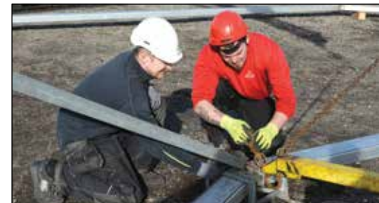
Det kræver samarbejde at lave en sikker teltopstilling.