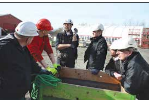
God planlægning og arbejdsfordeling kræver møder, hvor informationer gives, så alle kender deres opgaver.