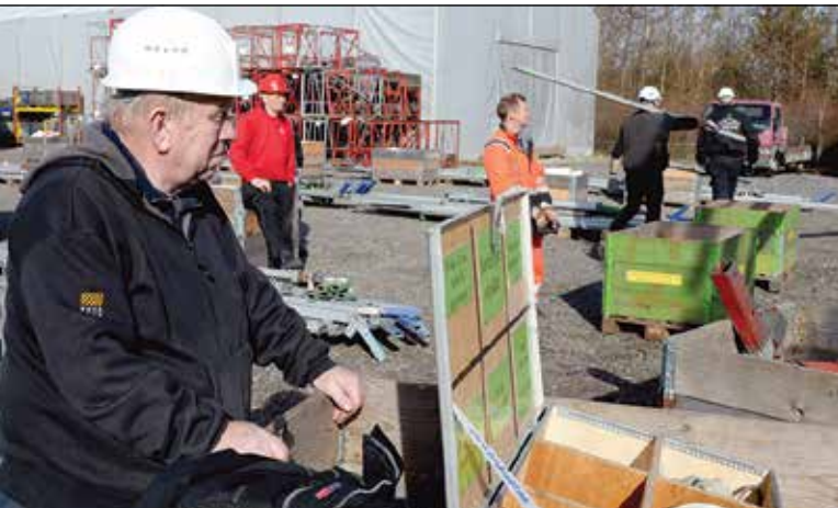
Teltmontørkurserne er med til at give deltagerne overblik over opstilling af små som store telte.