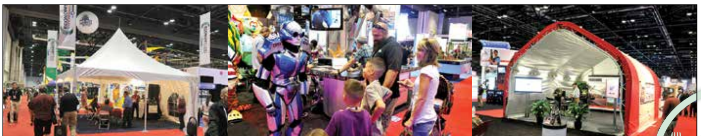
Udfordringerne på IAAPA messen i Orlando er uendelige. Her udstiller over tusind producenter de nyeste forlystelser.