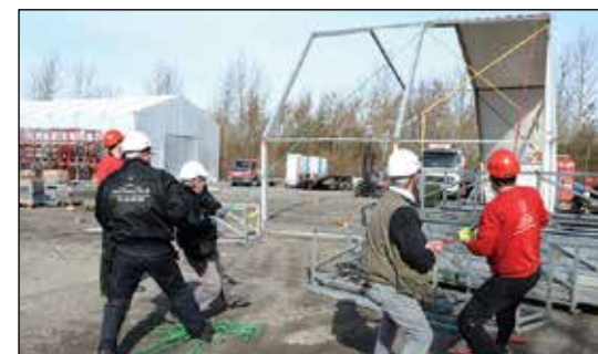
Det kræver teknik og kræfter at trække de store tagduge på som her, hvor det er et 18 m bredt telt, der monteres tagduge på.