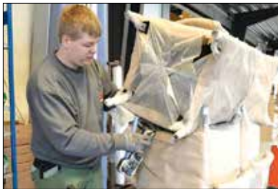
Hurtig betjening og forsendelse på mellem 3 og 5 dage er konceptet hos Zederkof, Fredericia.