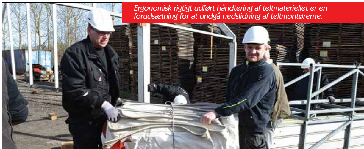
Ergonomisk rigtigt udført håndtering af teltmaterialet er en forudsætning for at undgå nedslidning af teltmontørerne.