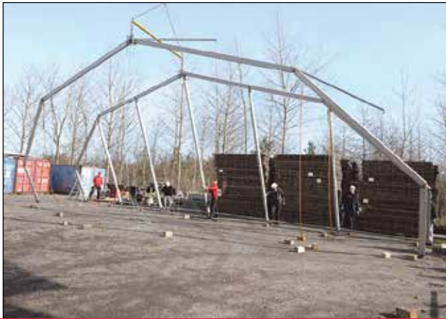
Store teltkonstruktioner med mange hundrede kilos vægt vinder frem i Danmark, men der er ingen krav til uddannelse af teltmontørerne.