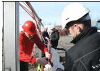
Vindkryds i teltene er en vigtig forudsætning for at give den optimale sikkerhed i opstillingen.

– Vi er som Brancheforeningen af professionelle teltudlejere der vil gøre en forskel, gået et skridt foran alle andre. Vi kræver, at der nu skal være en uddannet teltmontør i hvert medlemsfirma. Til næste år skal der være mindst en uddannet teltmontør ved hver teltopstilling. Det for at sikre den optimale opstilling og sikkerhedsarbejde under såvel opstilling som nedtagning.