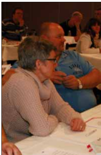
Der lyttes intenst til formandens beretning.