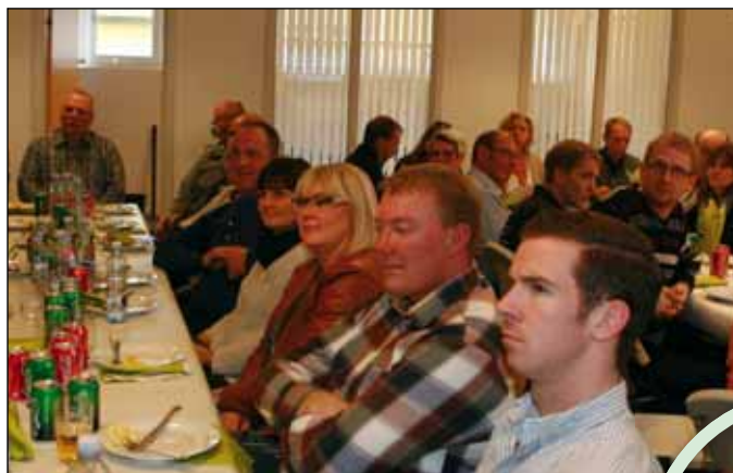
Deltagerne i virksomhedsbesøget lytter her til beretningen om Ikast-virksomheden Ikadan.