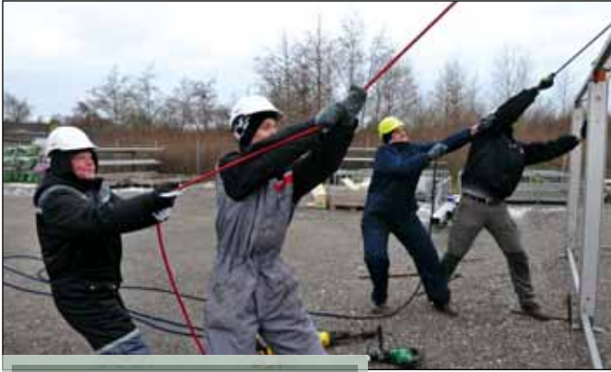
Der knokles på AMU-uddannelsen.