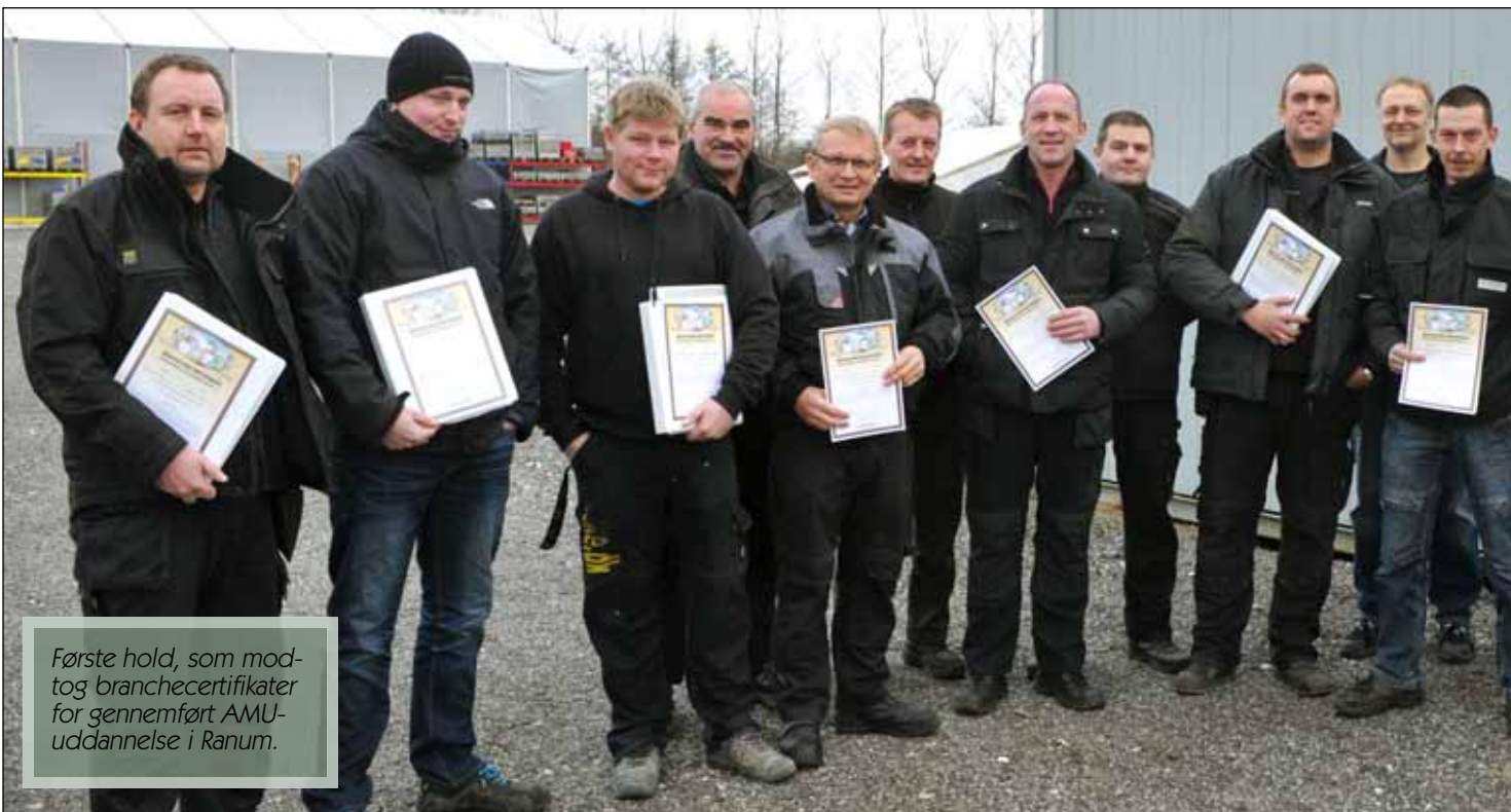
Første hold, som mod- tog branchecertifikater for gennemført AMU- uddannelse i Ranum.