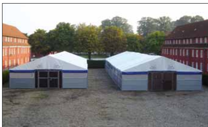
Sådan tager de 64 hestebokse, som Kongehuset lejer, sig ud.